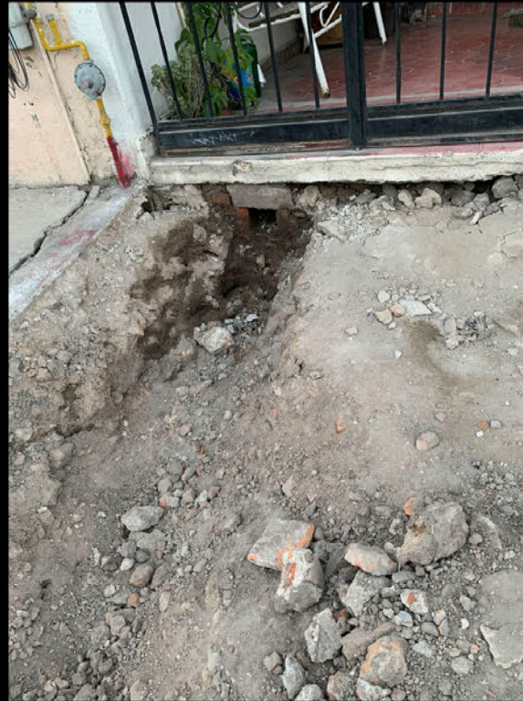
Calle Pedro Vallejo: Canal de salida de drenaje hecho por los vecinos porque no hay tubo conectado a la red.