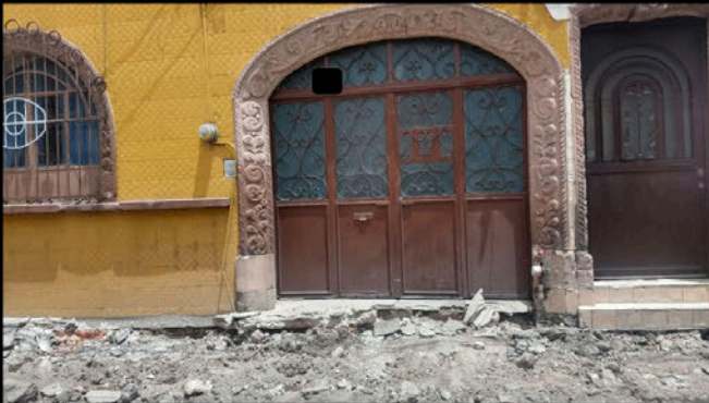
Calle 5 de Mayo: Residencia. No hay banqueta. La entrada de la casa quedó muy alta y es difícil el acceso. Uno de los residentes ya sufrió una caída. También vive una persona en silla de ruedas que tiene citas médicas constantes y no puede salir.