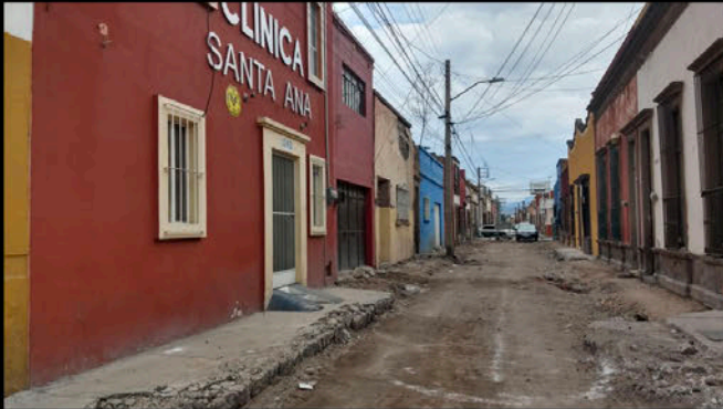
Calle 5 de Mayo: Clínica. Hay banqueta parcial. Se dificulta el acceso de ambulancias y de personas en silla de ruedas y camilla.