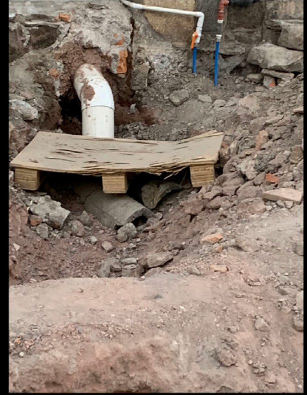
Calle Pedro Vallejo: Drenaje sin conectar, tubos de PVC y concreto.