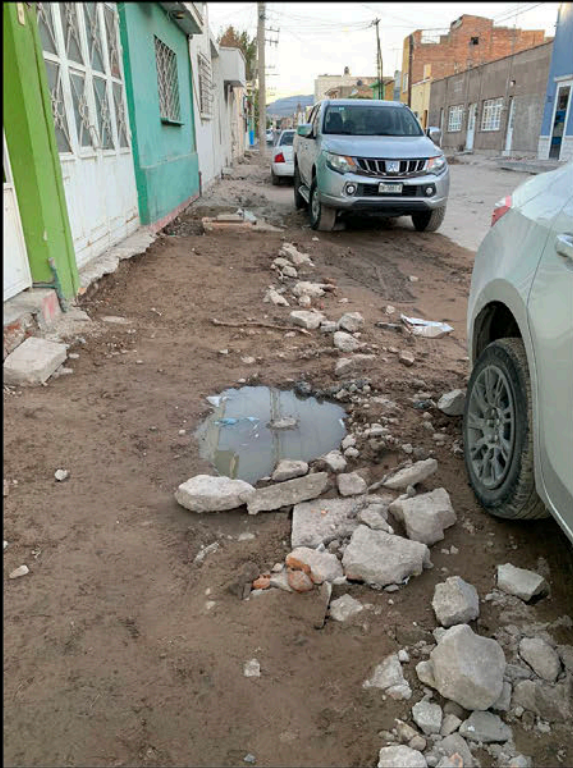
Calle Pedro Vallejo: Fuga de drenaje enfrente de una residencia.