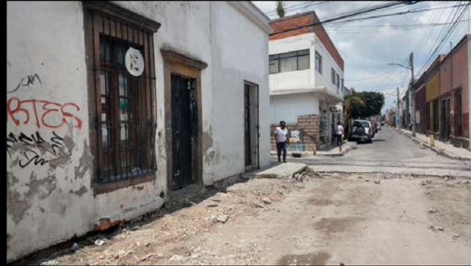
Calle 5 de Mayo: Taller de bicicletas. No tiene toma de agua, a pesar de que el vecino ya la ha solicitado a INTERAPAS desde hace tiempo.