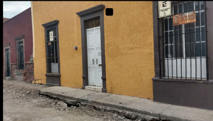
Calle 5 de Mayo: Residencia. Viven adultos mayores, uno de ellos en silla de ruedas. Hay banqueta parcial pero no hay forma de salir de la cuadra. La entrada de la casa quedó muy alta, hay un hoyo debajo de la banqueta que quedó y no hay bajada para sacar vehículos. Hay riesgo de caídas. Cae poca agua y debido a la inaccesibilidad de la calle, la pipa de agua no puede entrar a abastecer. Tampoco pueden entrar vehículos que llevan servicios de comida y agua potable; la vecina debe pagar extra para que los repartidores le carguen los productos hasta la puerta.