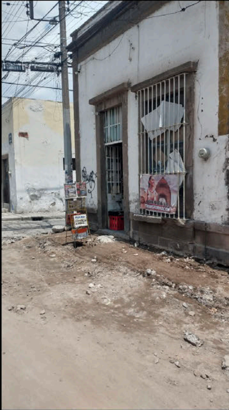
Calle 5 de Mayo: Tienda. Hace una semana que no cae agua. No hay banqueta. Se dificulta el acceso a clientes, de los cuales muchos son adultos mayores. Hay riesgo de caídas.