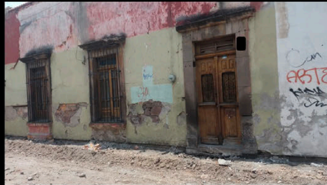
Calle 5 de Mayo: Residencia. No tiene toma de agua a pesar de haberla solicitado a INTERAPAS. No hay banqueta. Vive persona adulto mayor a la que se le dificulta el acceso a su casa.