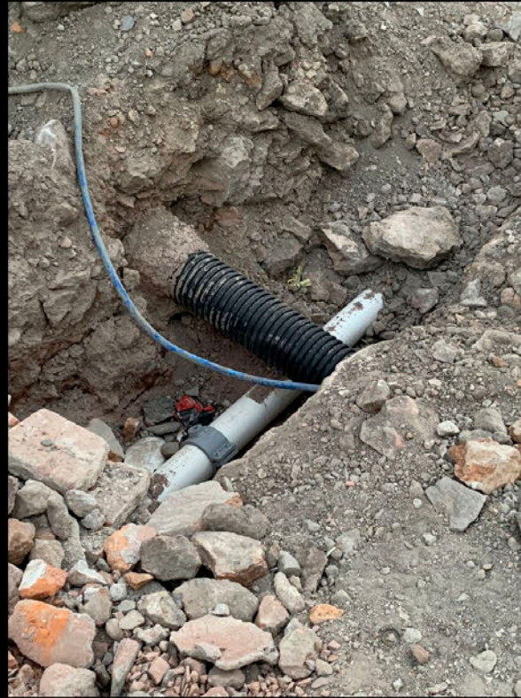
Calle Pedro Vallejo: Cruce de tuberías de todo tipo