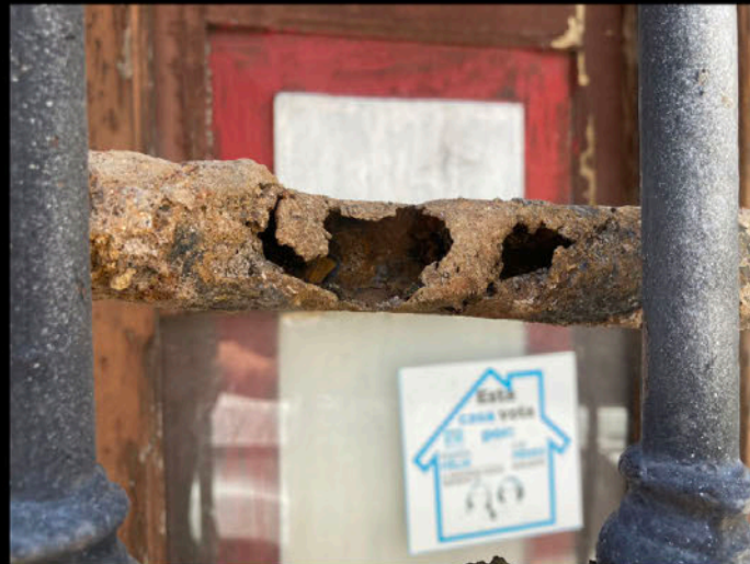
Calle 5 de Mayo: Estado de las tuberías de agua