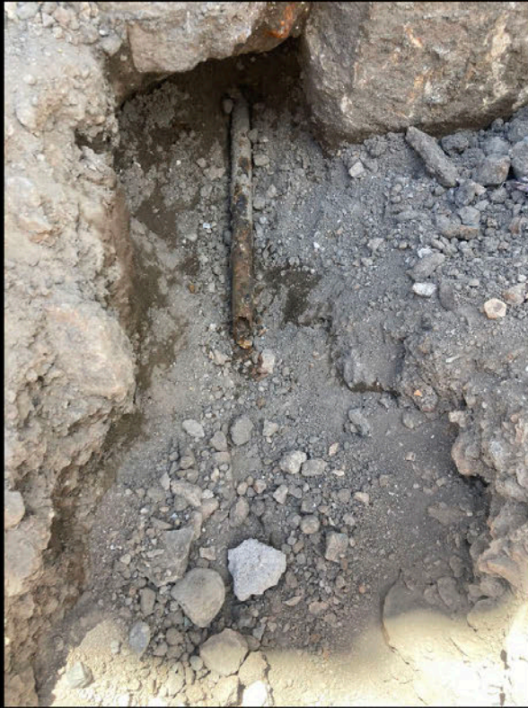
Calle 5 de Mayo: Parte del tubo de una toma domiciliaria donde vecinos reportan que lleva años sin agua