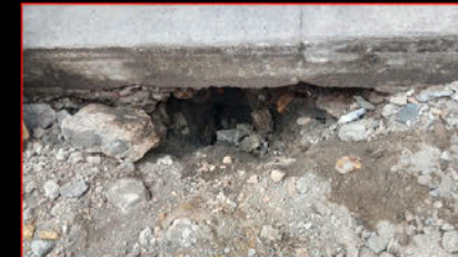
Calle 5 de Mayo: Residencia y negocio familiar. No hay banqueta. Hay un hoyo de drenaje en el acceso a la casa. Viven adultos mayores. Mucha clientela también es adulta mayor y se les dificulta el acceso al negocio.